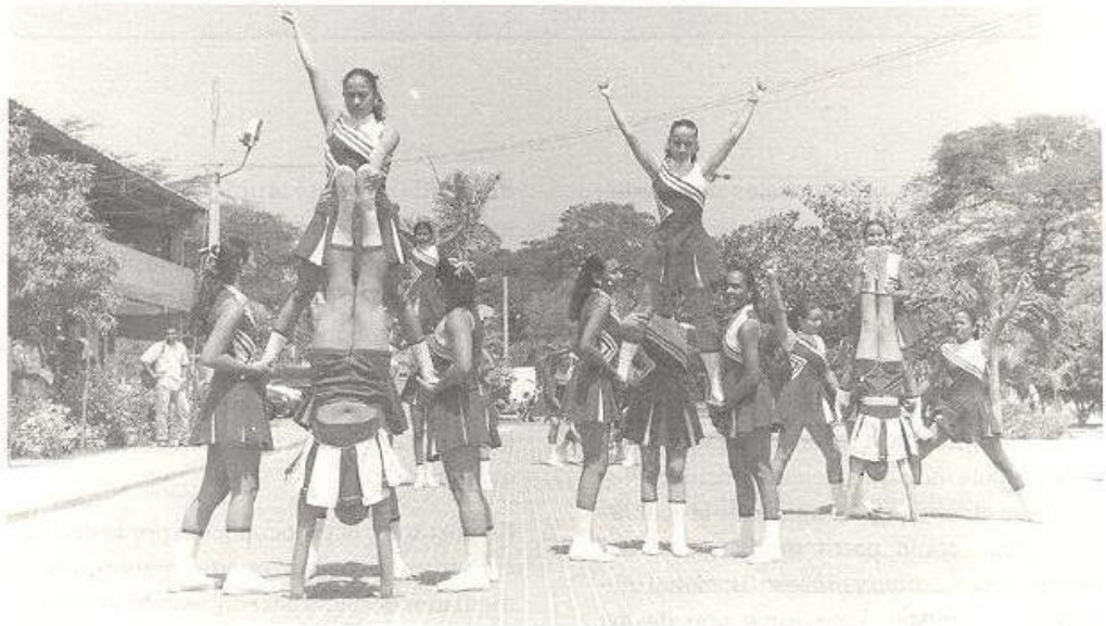
Proyecto de articulación con los niveles precedentes.