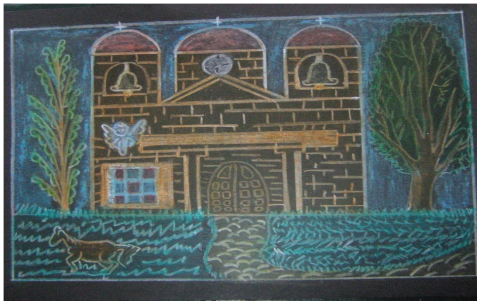
Figura 4 Ilustraciones con pasteles grasos. 3