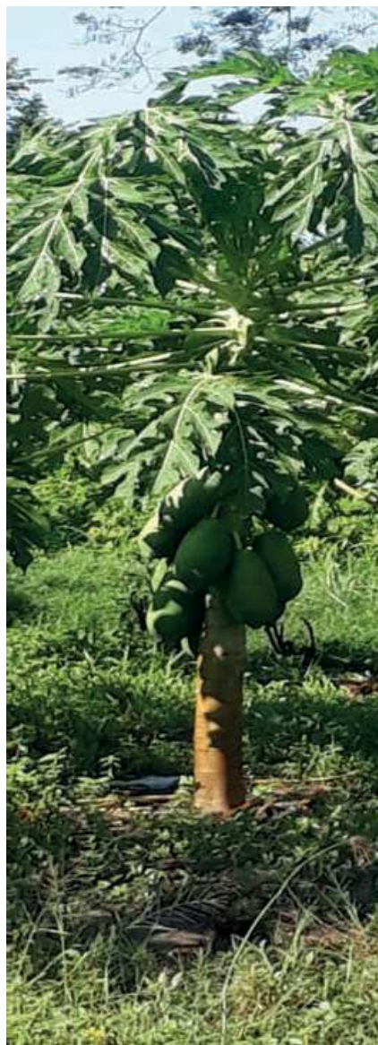
Actividad productiva del CCRG (cultivo de papaya) de conformidad con la cosmovisión propia

El periódico Opinión Caribe registró la ocurrencia de un incendio forestal en medio del conflicto territorial antes señalado, el cual ocasio-