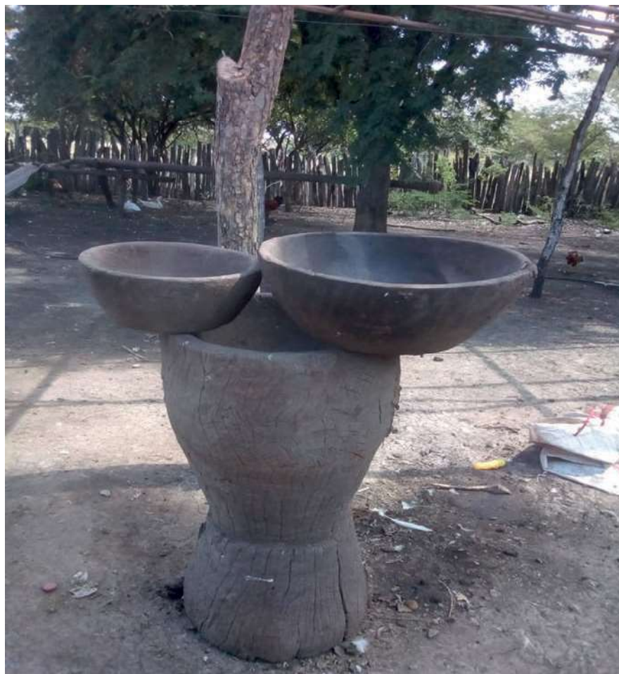
El pilón, herramienta tradicional para pilar el arroz de manera manual (saber ancestral)

El pueblo negro de Rincón Guapo Loveran es víctima de una violencia de larga duración por el comportamiento histórico de un Estado colombiano que excluye, margina, discrimina y no es garantista de derechos para la población negra, afrocolombiana, raizal y palenquera,