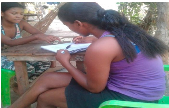
Encuesta realizada a madres adolescentes de la comunidad de estudio / Diosabeth Comas, 2019.

Se puede concluir que la estigmatización negativa de ver la maternidad y el embarazo en las adolescentes como un problema que recae principalmente en las adolescentes, es una percepción que ha sido construida por los habitantes adultos de la comunidad y por los funcionarios de las instituciones estatales, contrario al pensamiento y percepción de las madres adolescentes, para quienes desde su subjetividad femenina, la maternidad es un estado natural de la mujer y es lo que lleva a la conformación de una familia, que es la base de la sociedad. En esta medida, cualquier intervención territorial, institucional y de política pública debería considerar la opinión y experiencia de las jóvenes y, junto con la familia y la sociedad, desarrollar estrategias de salud sexual y reproductiva que sean más acordes a las necesidades y estilo de vida de las adolescentes.