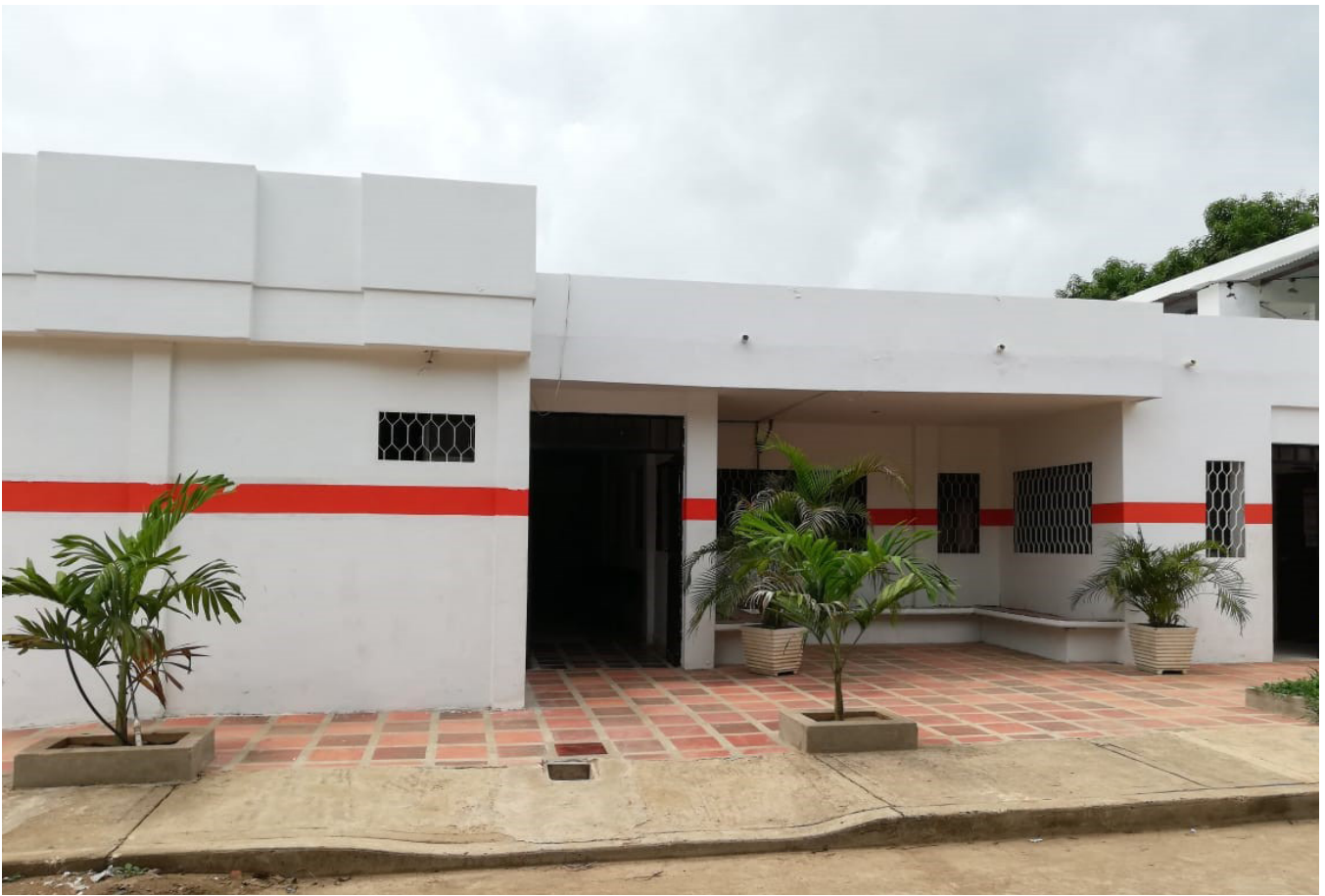
Centro de salud del municipio de San Sebastián, Hospital Rafael Paba Manjarrez de San Sebastián de Buenavista, Magdalena / Diosabeth Comas, 2019.

Para los profesionales en el área de la salud, el embarazo adolescente trae diversas complicaciones en la salud del bebé y la madre a corto y largo plazo. En general, se considera que el embarazo adolescente es causa de deserción escolar, incremento de pobreza en la comunidad, impide el desarrollo personal de las adolescentes y no trae ningún beneficio.