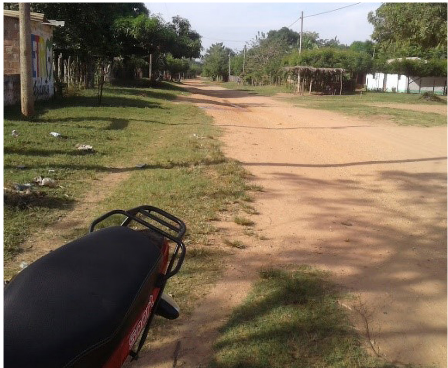
Calles de la comunidad de El Recreo y San José de Chimila, entrada desde Astrea, Cesar / Diosabeth Comas, 2018.

instituciones estatales, y cómo esto ha influido en la experiencia misma del embarazo y en la maternidad de las adolescentes que habitan en la población que conforman las veredas El Recreo, del municipio de San