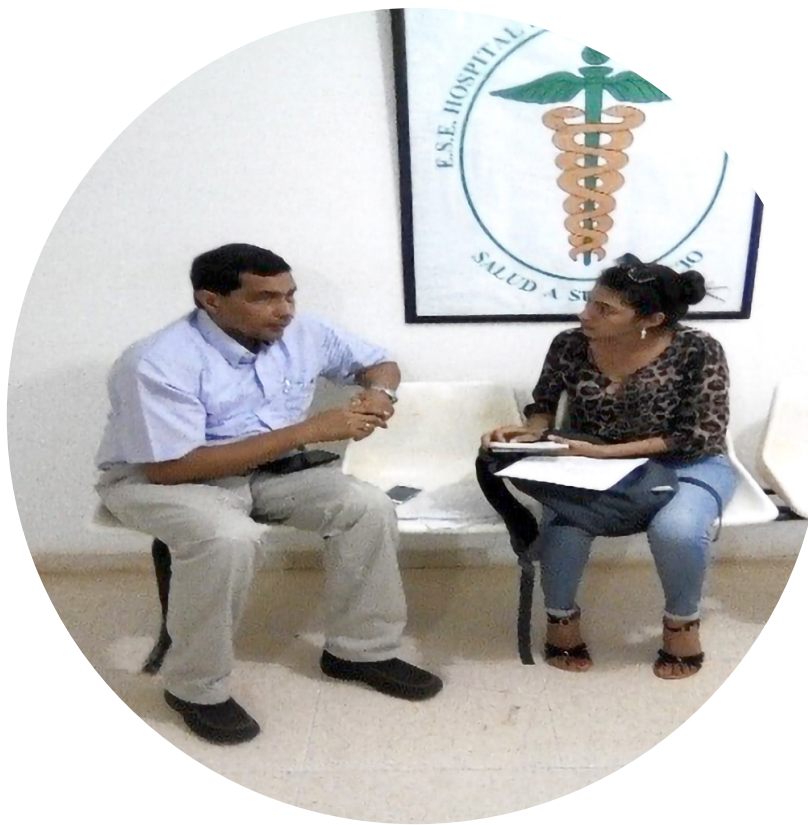
Conversación con médico coordinador del Hospital Rafael Paba Manjarrez de San Sebastián de Buenavista, Magdalena