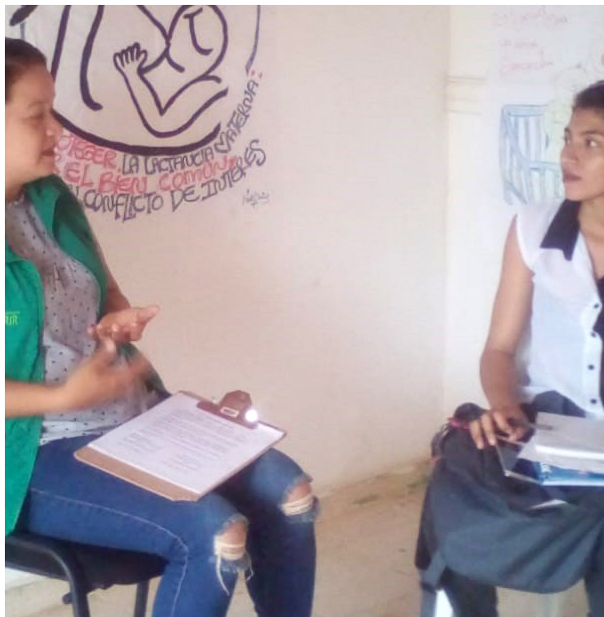
Diálogo con la coordinadora del Programa Desarrollo Infantil en Medio Familiar de ICBF encargada de la zona de El Recreo y San José de Chimila / Andrés Comas, 2018.

Siguiendo con la idea de la estigmatización negativa de la maternidad adolescente, Adazko (2005), Oviedo y García (2011) consideran que verlo de esta forma se constituye en un mecanismo de control de los cuerpos y subjetividad femenina de las adolescentes por parte de sus familias y la sociedad en general. Referente a esto, como se pudo observar en la población de estudio, las instituciones como las escuelas, el hospital y la sede del Instituto Colombiano de Bienestar Familiar (ICBF) del municipio de San Sebastián de Buenavista (Magdalena), son entidades que buscan ejercer, de cierta forma, control sobre los cuerpos e imaginarios de los adolescentes, mediante la implementación de métodos anticonceptivos, programas y brigadas de educación sexual y reproductiva, programas orientados principalmente hacia las jóvenes, recayendo sobre las mujeres la mayor responsabilidad. Este control también se hace explícito a través del rechazo y discriminación que sufren las jóvenes embarazadas por parte de sus familiares y la sociedad.