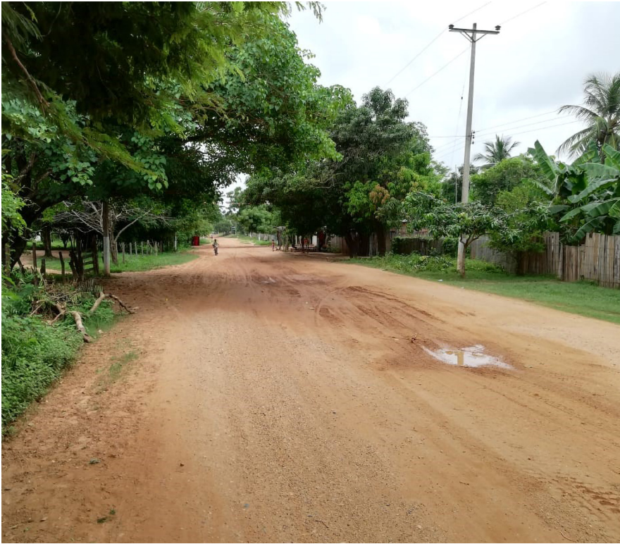
Entrada a la comunidad de la vereda El Recreo y San José de Chimila desde el municipio de San Sebastián de Buenavista, Magdalena / Robert Martínez, 2019.