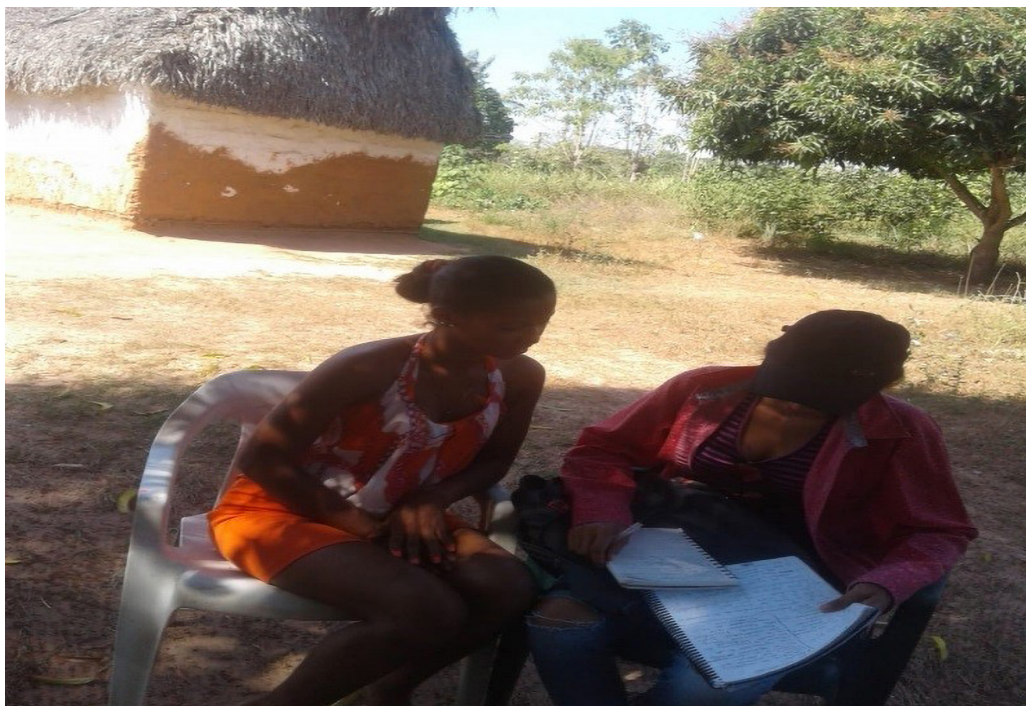
Entrevista a una de las madres adolescentes, vereda San José de Chimila / Andrés Comas, 2019.

Por ejemplo, se identificó dos tipos de embarazos: el deseado y el no deseado. El embarazo deseado se da por la necesidad de las jóvenes de crear un vínculo con sus parejas, conformar una familia y crear un lazo emocional