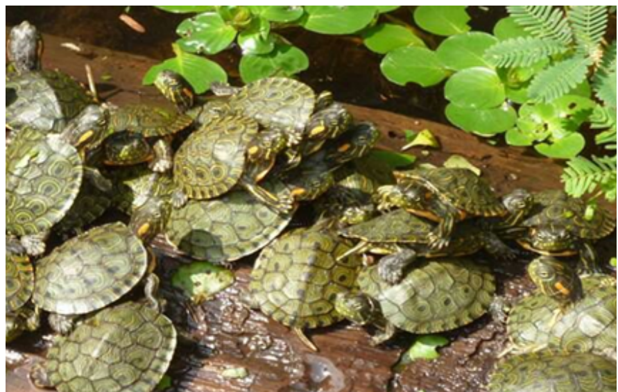
Tortugas galápagas liberadas en la rivera del río

En Conclusión, la incubación artificial resultó como una alternativa innovadora que permite hacer un uso y manejo sustentable de la tortuga Galápagas, a la vez que es un proceso de reafirmación de los conocimientos y prácticas locales que se resisten y negocian ante las fuerzas externas que pretenden transformar las dinámicas locales sin conocerlas.