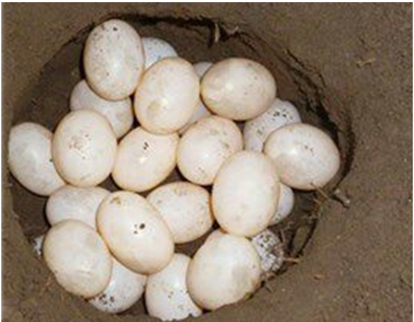
Huevos de tortuga galápaga recolectados por la comunidad /Viviana Jiménez, 2015

Las Incubadoras artesanales estilo troja son construidas por los habitantes de las Margaritas con materiales reciclados, entre ellos madera y metal.