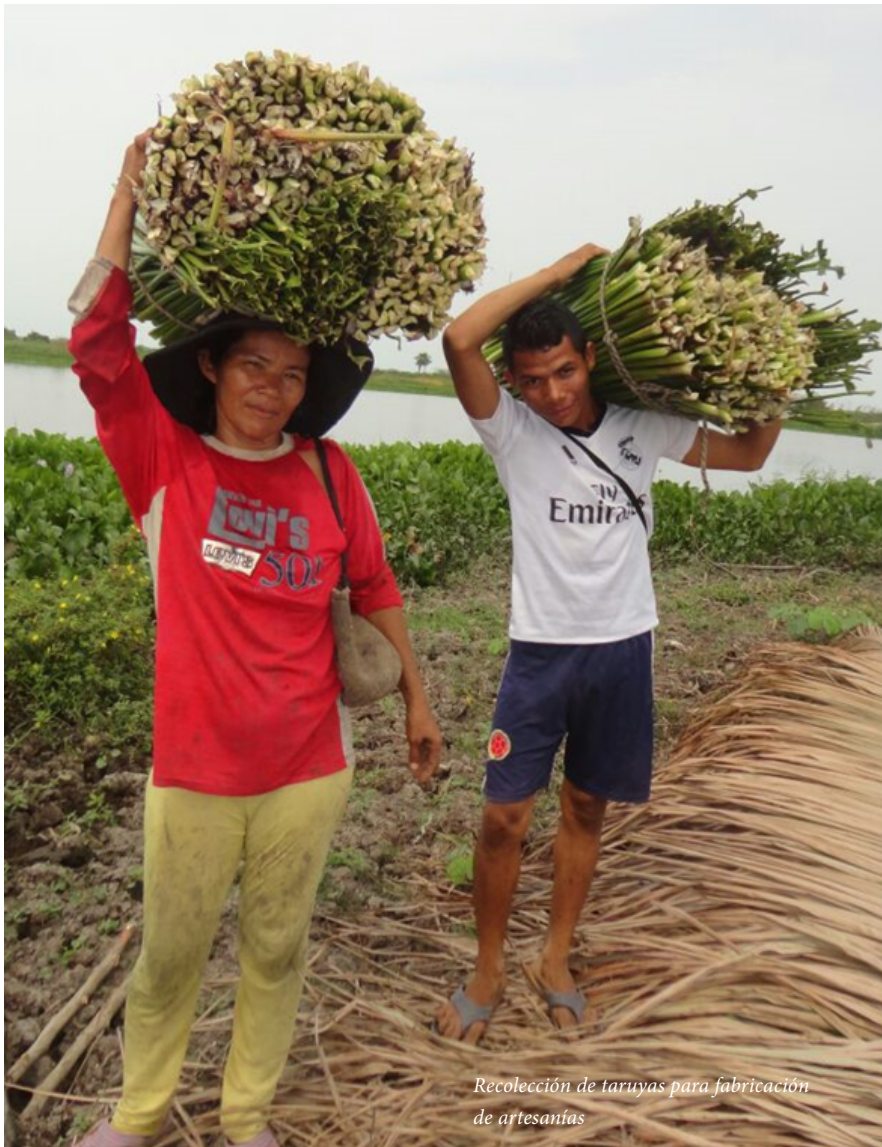
Recolección de taruyas para fabricación de artesanías

Sostenibilidad Eco. Las Margaritas /Viviana Jiménez, 2015