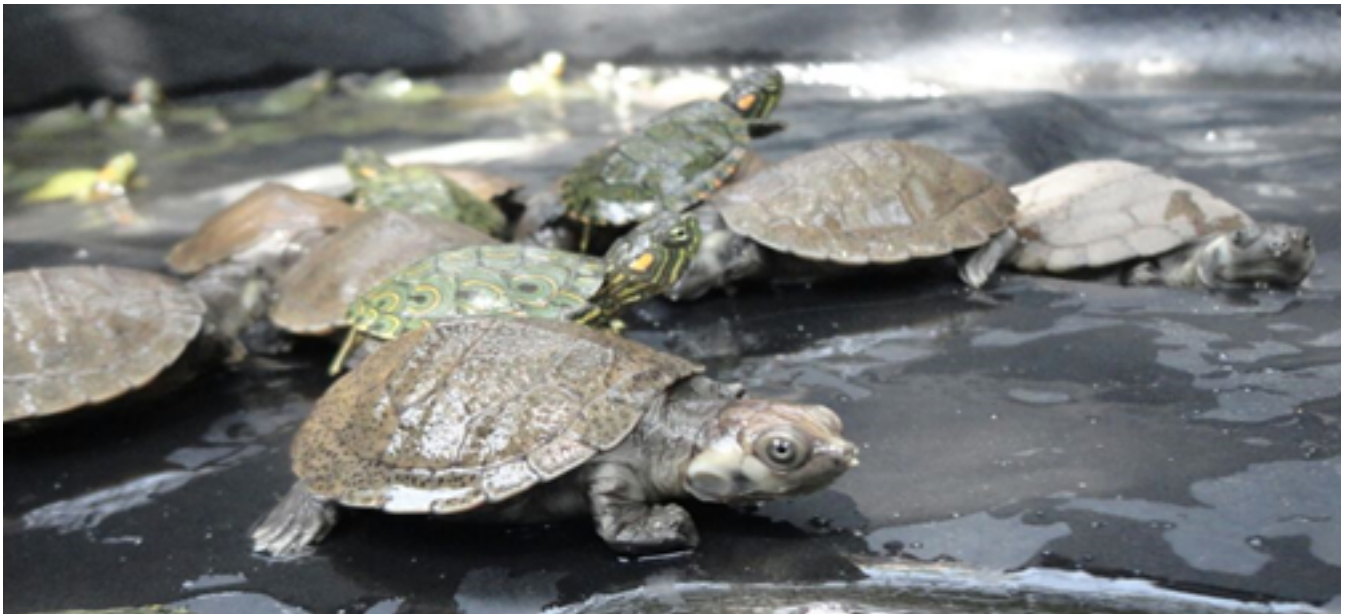
Etapa de sostenimiento de neonatos de tortugas galápagas / Viviana Jiménez, 2015

Después de un mes de que las tortugas ( Tachemys Callirostris ) han eclosionado, la comunidad las libera en las ciénagas y ríos que se encuentran ubicados alrededor de Las Margaritas.