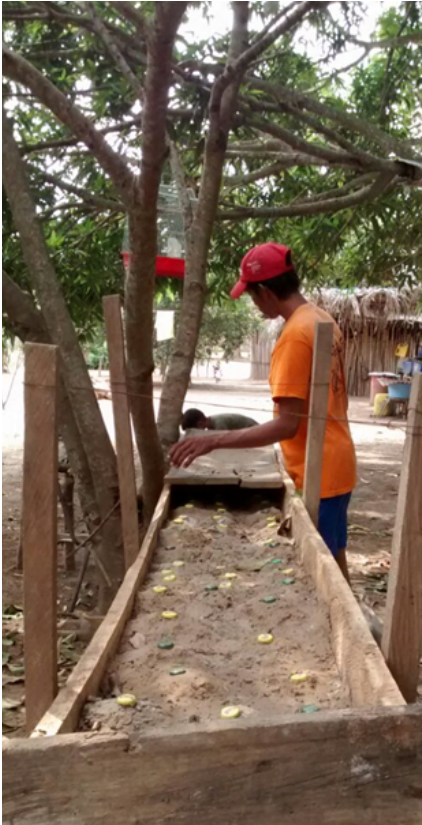
Integrante de la comunidad marcando la incubadora con la posible fecha de eclosión de las tortugas galápagas

Ubicados los huevos de las tortugas en las cajas incubadoras, los habitantes de la comunidad proceden a marcar con tapas de botellas plásticas la posible fecha en que eclosionaran las tortugas, este método es más duradero y les permite mejor la organización y señalamiento de los nidos (o matas). Una vez se recolectan los huevos de las galápagas, se procede a construir en la incubadora pequeños agujeros en la tierra, donde posteriormente serán depositados y cubiertos con tierra con el fin de protegerlos y mantener la temperatura. La incubadora es tapada posteriormente con una tabla de madera, tejas de eternit o los materiales que se tengan a disposición.