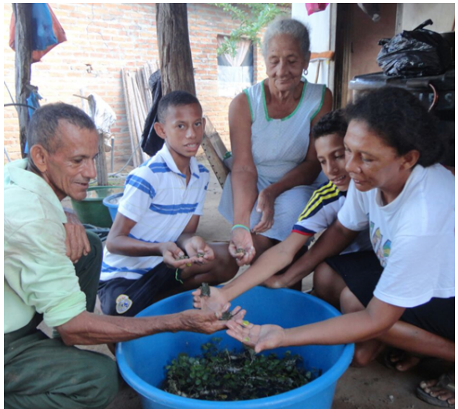
Familia Ospino alimentando tortugas galápagas recién nacidas

Las tortugas una vez eclosionan, la comunidad procede a reubicarlas en contenedores plásticos, donde son depositadas para posteriormente ser alimentadas. Esta actividad en este caso estuvo a cargo de la familia Ospino, donde los niños, abuelos y adultos se encargan del cuidado y alimentación de las pequeñas galápagas.