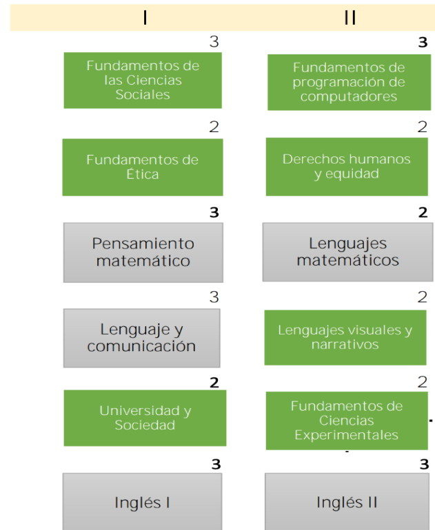
Figura 1. Año de Estudios Generales