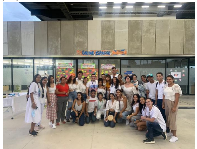
Figura 6. Fotografías del proyecto final «Gestar espacios pacíficos»

Soy es un discurso impersonal que da cuenta del proceso de empoderamiento que tiene una mujer, que a lo largo de su vida ha sufrido de violencia de género y otros abusos. La narrativa marca una ruta por su historia y de la misma manera por los hitos de lucha y de interiorización que pone en conexión lo que sabía que tenía, pero había olvidado: su identidad (Programa de Gestión Cultural y Comunicativa, 2022, p. 3).