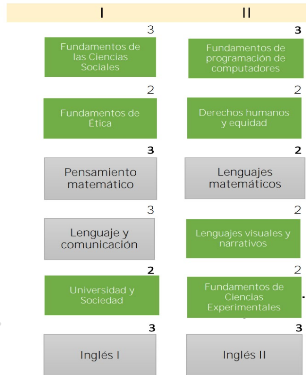
Figura 1. Año de Estudios Generales