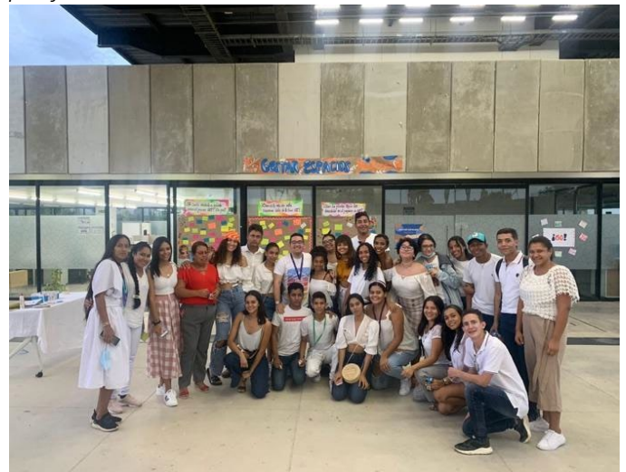
Figura 6. Fotografías del proyecto final «Gestar espacios pacíficos»

Soy es un discurso impersonal que da cuenta del proceso de empoderamiento que tiene una mujer, que a lo largo de su vida ha sufrido de violencia de género y otros abusos. La narrativa marca una ruta por su historia y de la misma manera por los hitos de lucha y de interiorización que pone en conexión lo que sabía que tenía, pero había olvidado: su identidad (Programa de Gestión Cultural y Comunicativa, 2022, p. 3).