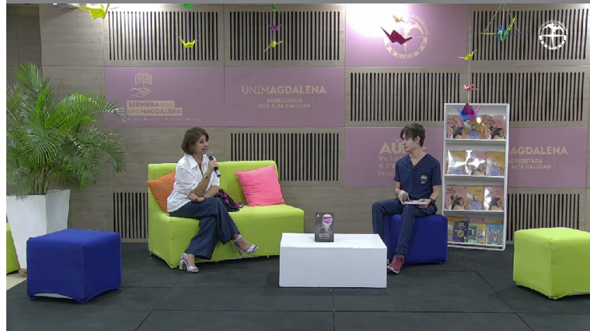
Intervención de la autora del libro durante el lanzamiento en el auditorio Playa Grande de la Universidad del Magdalena.