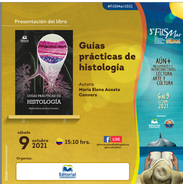
Banner del lanzamiento en virtud de la FilSMar 2021.

El lanzamiento del libro se desarrolló dentro del marco de la Feria Internacional del Libro, las Artes y la Cultura de Santa Marta FilSMar 2021 / 2da Edición virtual, en virtud de la jornada académica denominada: La salud en los libros.