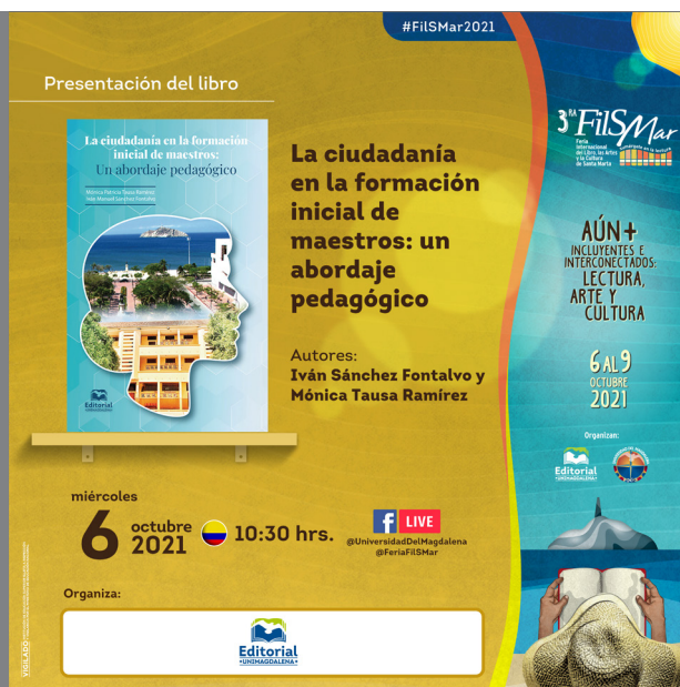
Banner del evento en la FilSMar 2021.

El lanzamiento del libro se desarrolló dentro del marco de la Feria Internacional del Libro, las Artes y la Cultura de Santa Marta FilSMar 2021 / 2da Edición virtual, en virtud de la actividad académica denominada: Cognición y ciudadanía en contexto.