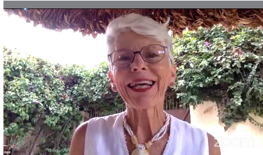
Intervención de la moderadora durante el lanzamiento del libro.