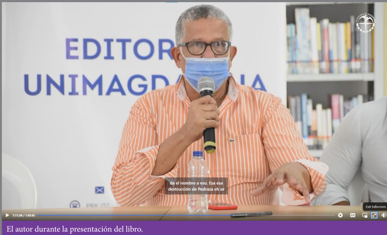
El autor durante la presentación del libro.