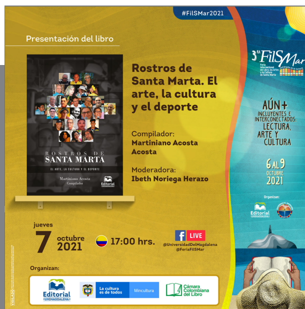
Banner publicitario del evento.