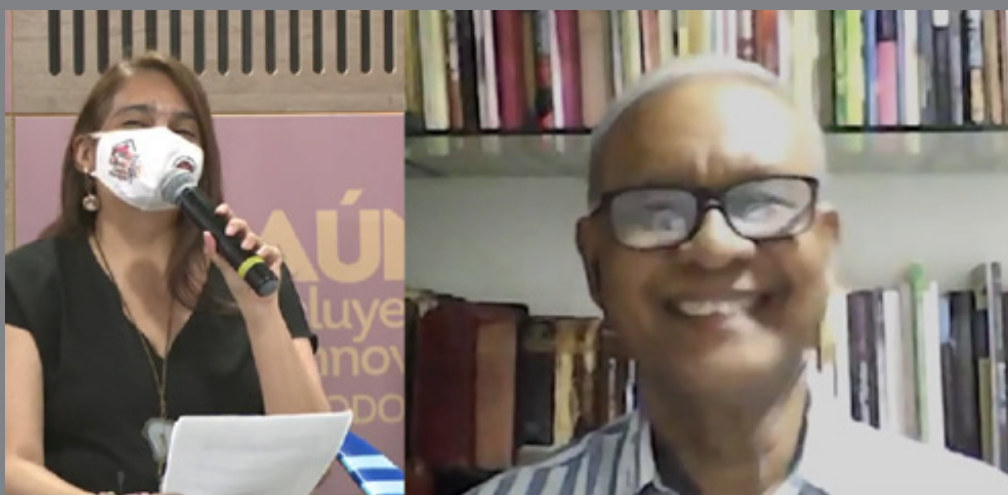
Proyección de la conexión entre la moderadora (desde el Set de presentaciones en el auditorio Neguanje de la Universidad del Magdalena) y el compilador del libro (conectado a través de la plataforma Zoom).