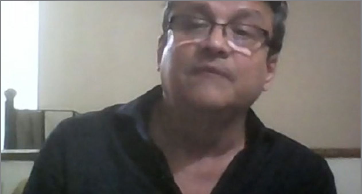
El moderador de la presentación del libro.