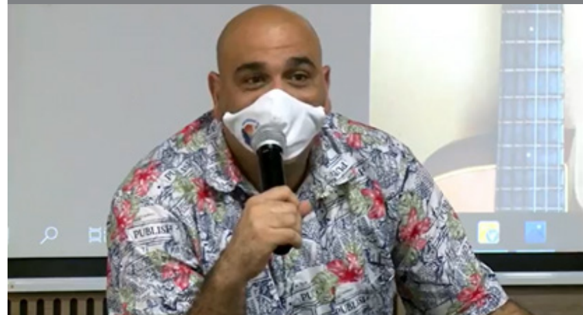
Palabras del entonces coordinador de publicaciones y fomento editorial, durante el lanzamiento del libro.