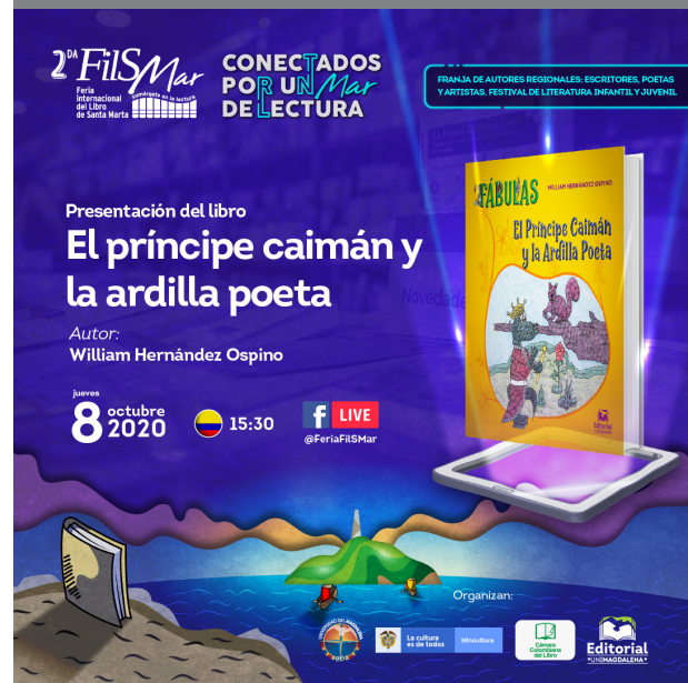
Banner publicitario del lanzamiento del libro en virtud de la FilSMar 2020.