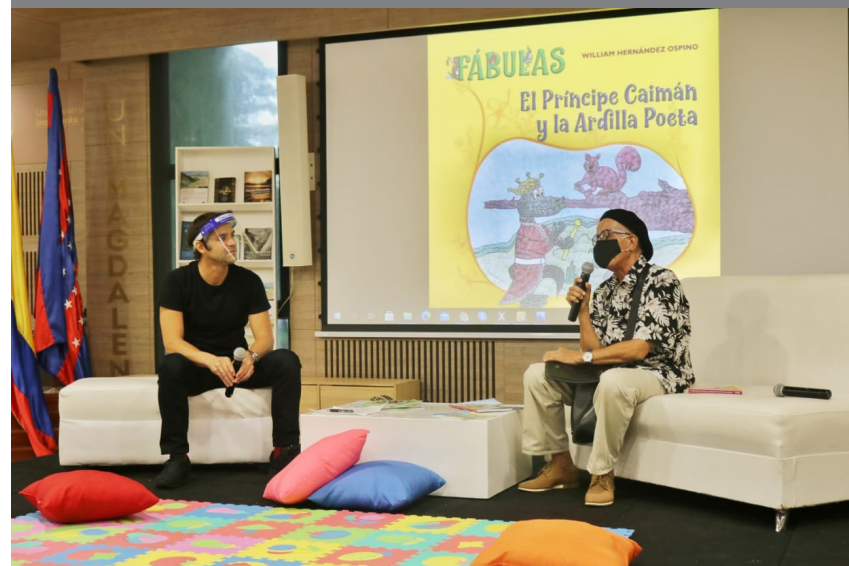
Autor y moderador durante el lanzamiento del libro en el auditorio Plata Grande de la Universidad del Magdalena.