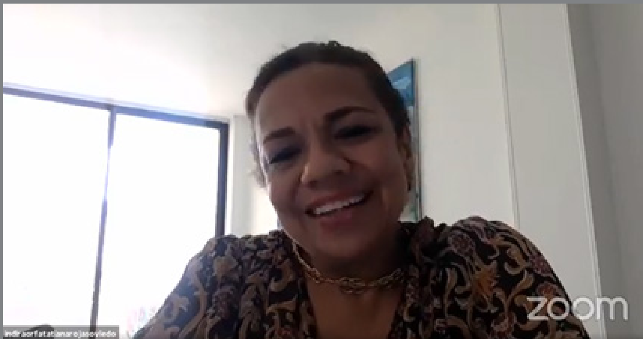
Intervención de la autora del libro, conectada a través de la plataforma Zoom.