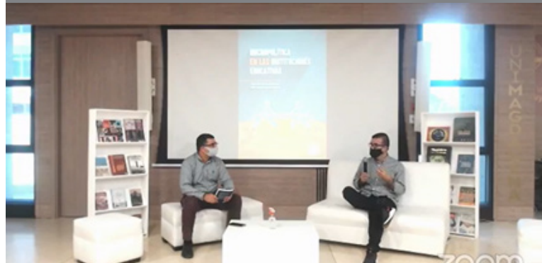
Intervención del autor del libro.