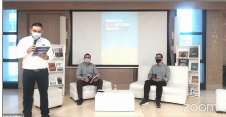
Lanzamiento del libro desde el auditorio Playa Grande del edificio Mar Caribe de la Universidad del Magdalena, en el marco de la 2.ª versión de la Feria Internacional del Libro de Santa Marta – FilSMar 2020 / 1.ª Edición Virtual.