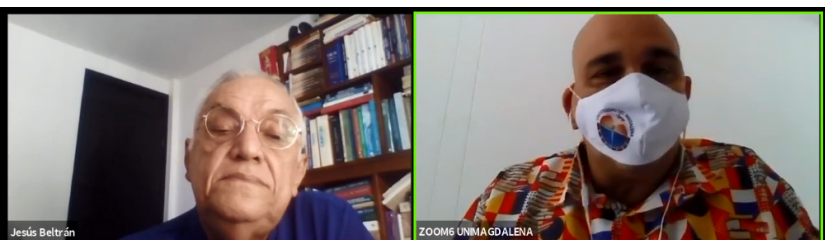
Conversación del autor con el moderador durante la presentación del libro en el marco de la FilSMar 2020.