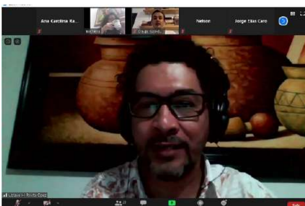
Intervención del editor durante la presentación del libro en la XX Semana Cultural 2020.