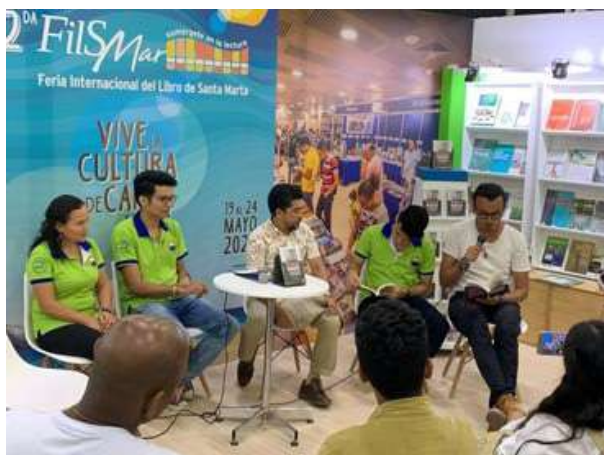
Intervención del editor y autores durante la presentación del libro en LIBRAQ 2019.