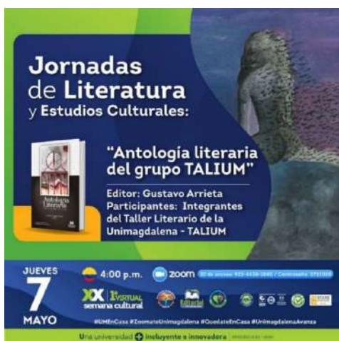
Banner publicitario del evento.