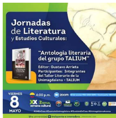
Banner publicitario del evento.