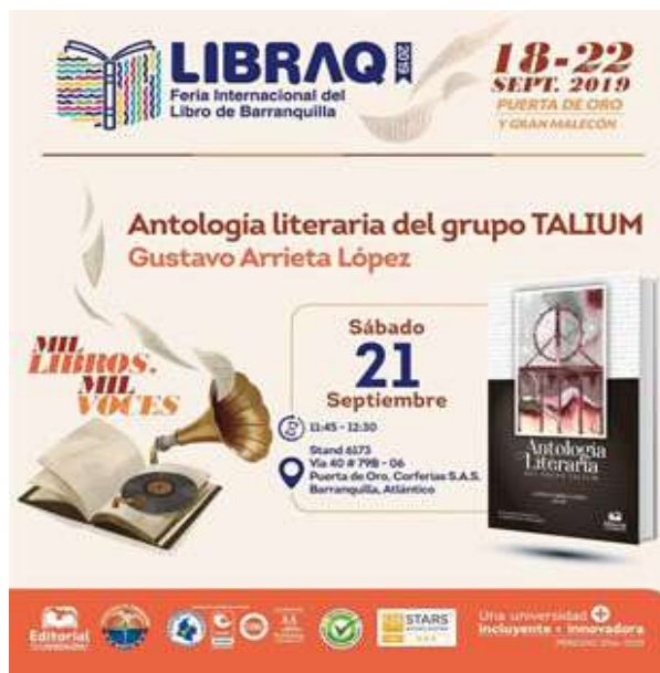
Banner publicitario del evento.