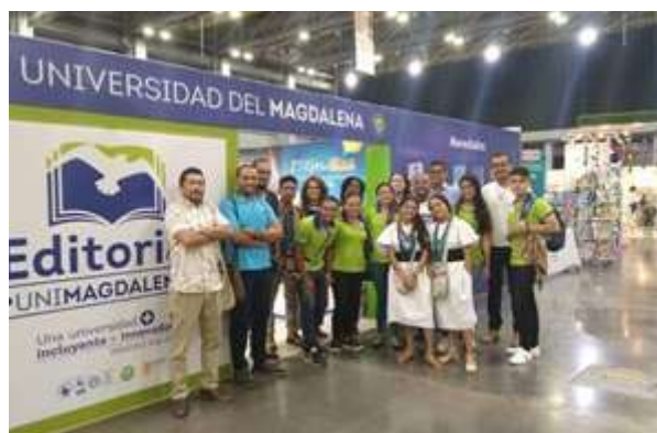
Editor y autores de la obra, en el Stan de la Editorial Unimagdalenista libro en LIBRAQ 2019.