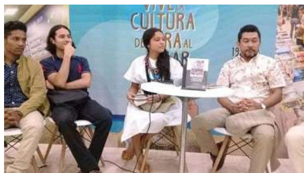
Presentación de la obra en la Feria Internacional del Libro de Barranquilla, LIBRAQ 2019.