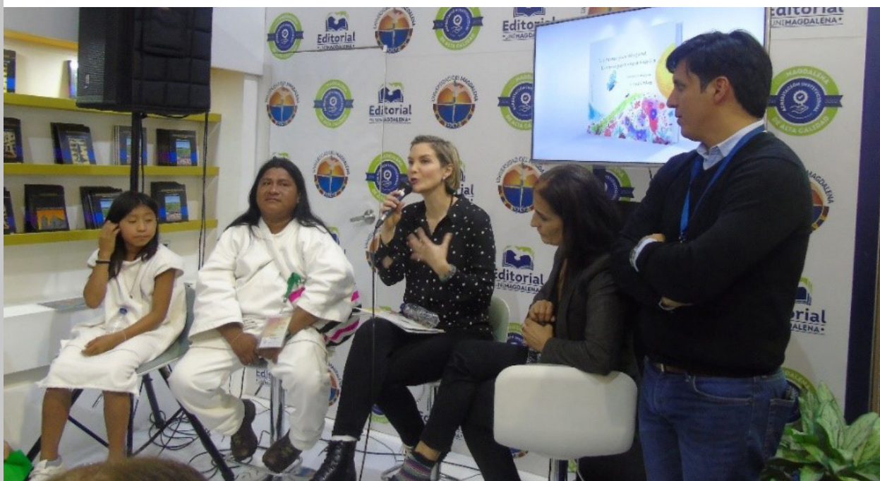
Figura 160. Presentación de la obra en la Feria Internacional del Libro de Bogotá, FILBO 2019