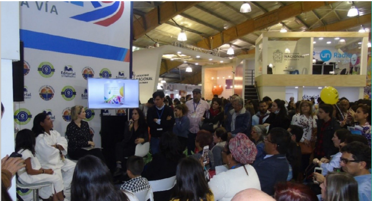
Figura 161. Público asistente a la presentación del libro Issa Abaksu Zawa Nóngutse / La Hormiguita Negra Negrita