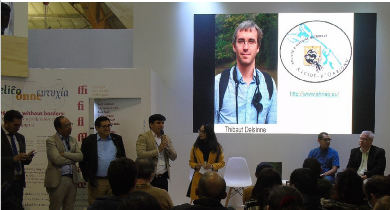
Figura 153. Intervención del Vicerrector de Investigación