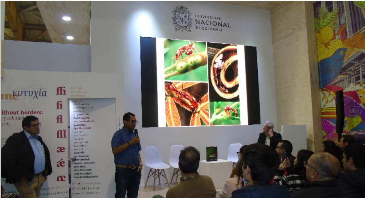
Figura 156. Público asistente a la presentación del libro