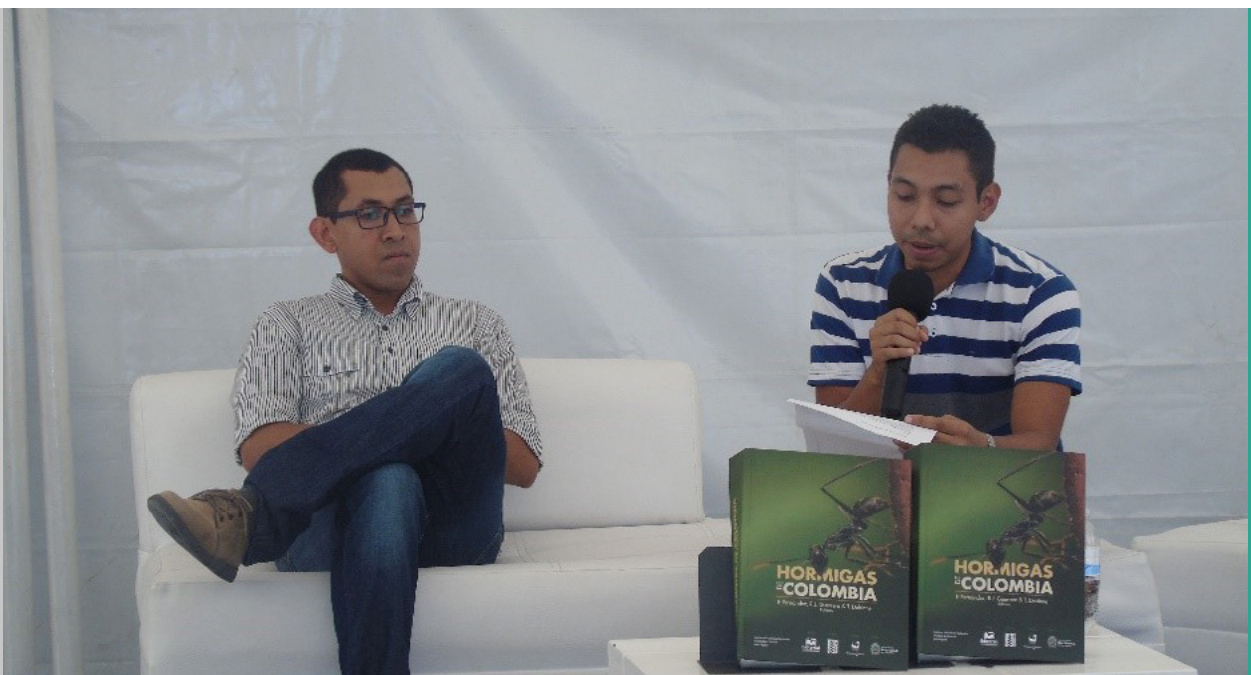
Figura 155. Presentación de la obra en la Feria del Libro de Santa Marta

El autor afirmó: “Con este libro se van a apasionar de unas lecturas que les permitirán aprender mucho más de este pequeño mundo y analizar las razones que hay para proteger las hormigas”.