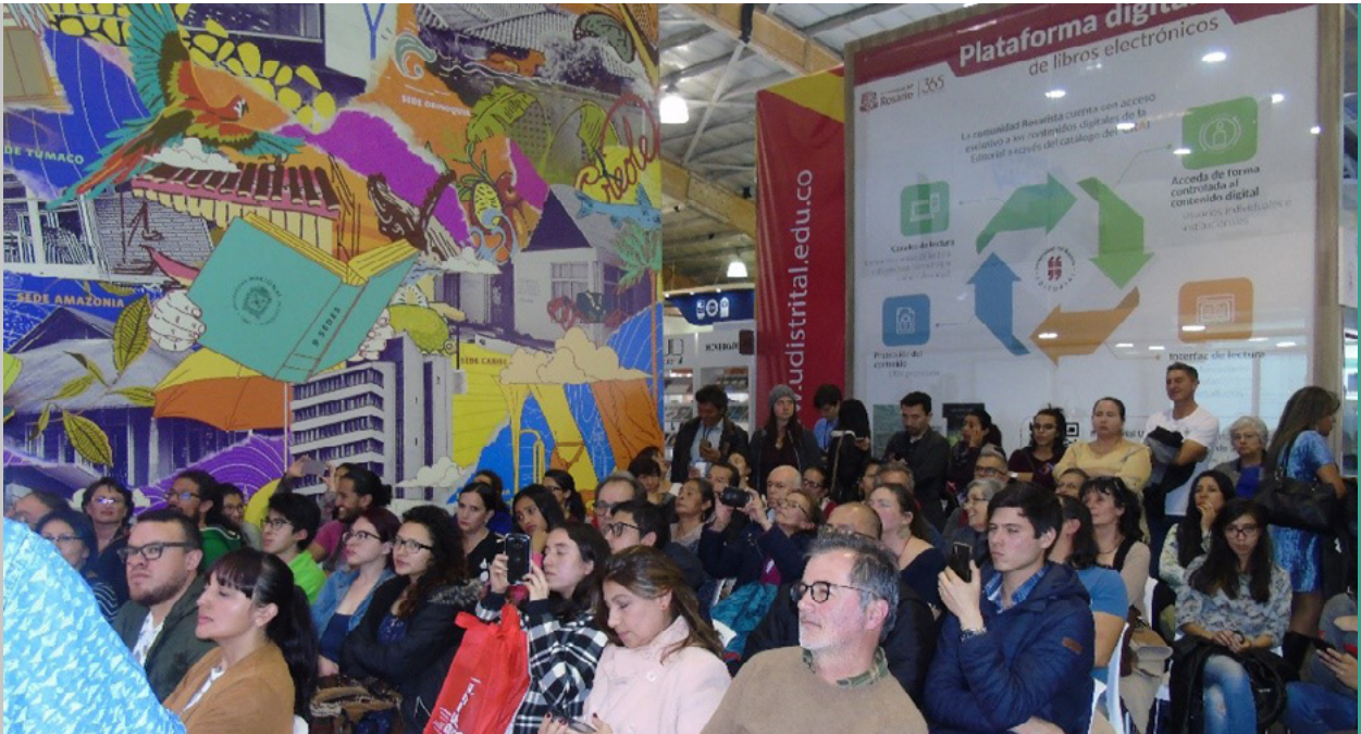
Figura 154. Público asistente a la presentación del libro