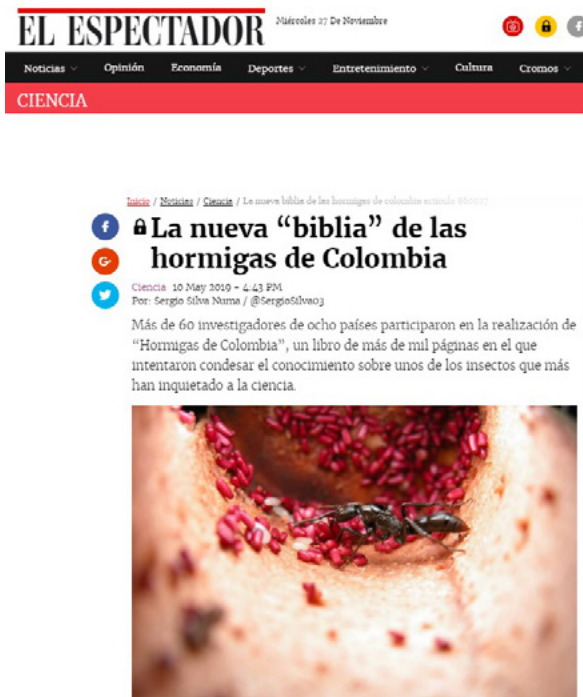
Figura 157. Columna del periódico El Espectador 48

“Más de sesenta investigadores de ocho países participaron en la realización de “Hormigas de Colombia”, un libro de más de mil páginas en el que intentaron condensar el conocimiento sobre unos de los insectos que más han inquietado a la ciencia”.