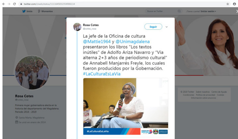
Figura 113. Cuenta de Twitter de la Gobernadora del Magdalena 31