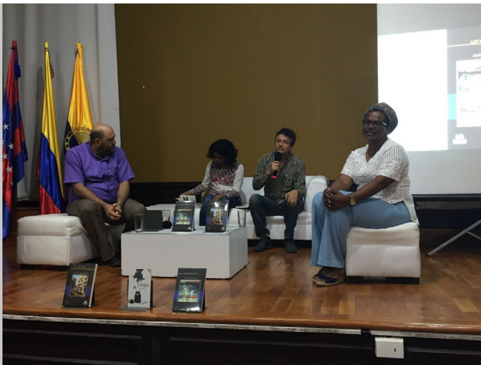
Figura 108. Presentación del libro en el Claustro San Juan Nepomuceno