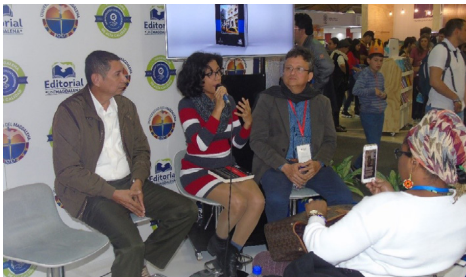
Figura 114. Presentación de la obra en la Feria Internacional del Libro de Bogotá, 2019