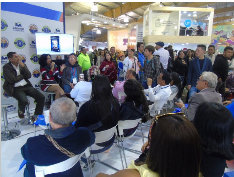
Figura 115. Público asistente a la presentación del libro en le FILBO, 2019

Asimismo, el escritor Adolfo Ariza argumentó: