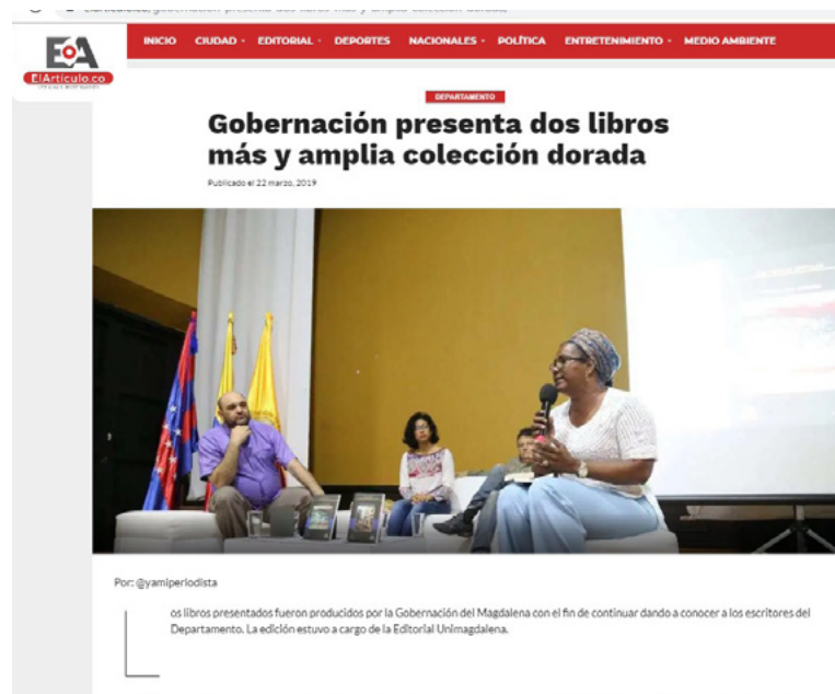
Figura 110. Artículo publicado por El Artículo.co 28