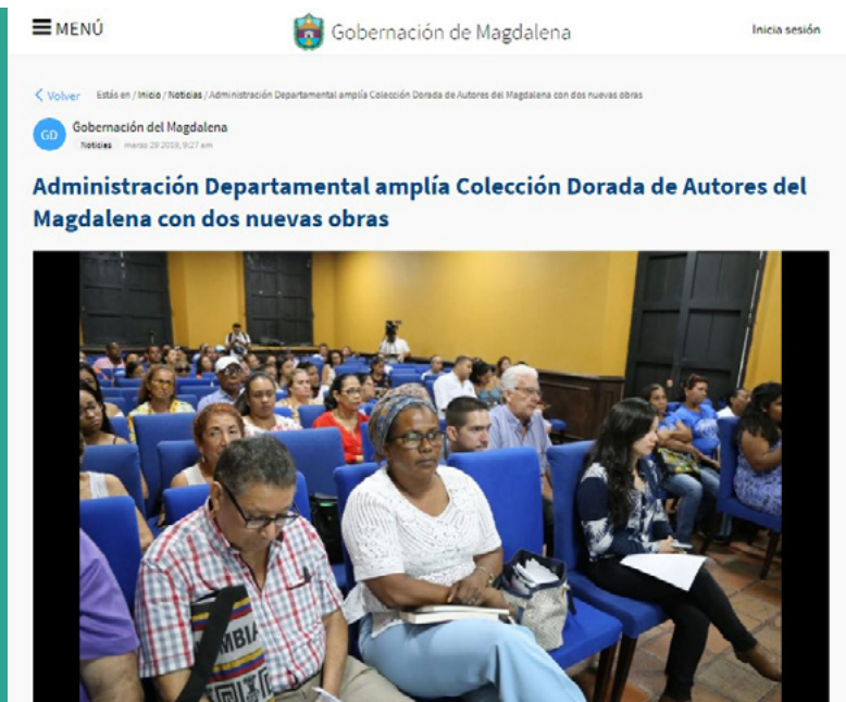
Figura 112. Divulgación del lanzamiento de la obra a través de la página web de la Gobernación del Magdalena 30

La gobernación del Magdalena, a través de su página web y redes sociales también divulgó la noticia del lanzamiento de las obras de la Colección Dorada en el Claustro San Juan Nepomuceno (figura 112 y 113).