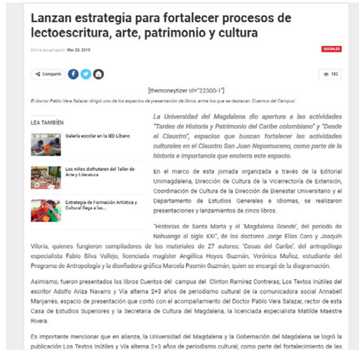
Figura 109. Artículo periodístico del periódico Hoy Diario del Magdalena 27

Así mismo, El artículo.co , divulgó: “Estas obras vienen a incrementar la Colección Dorada de Autores del departamento que está produciendo la Gobernación del Magdalena desde hace varios años con el propósito de dar a conocer a los escritores de esta zona del país y que