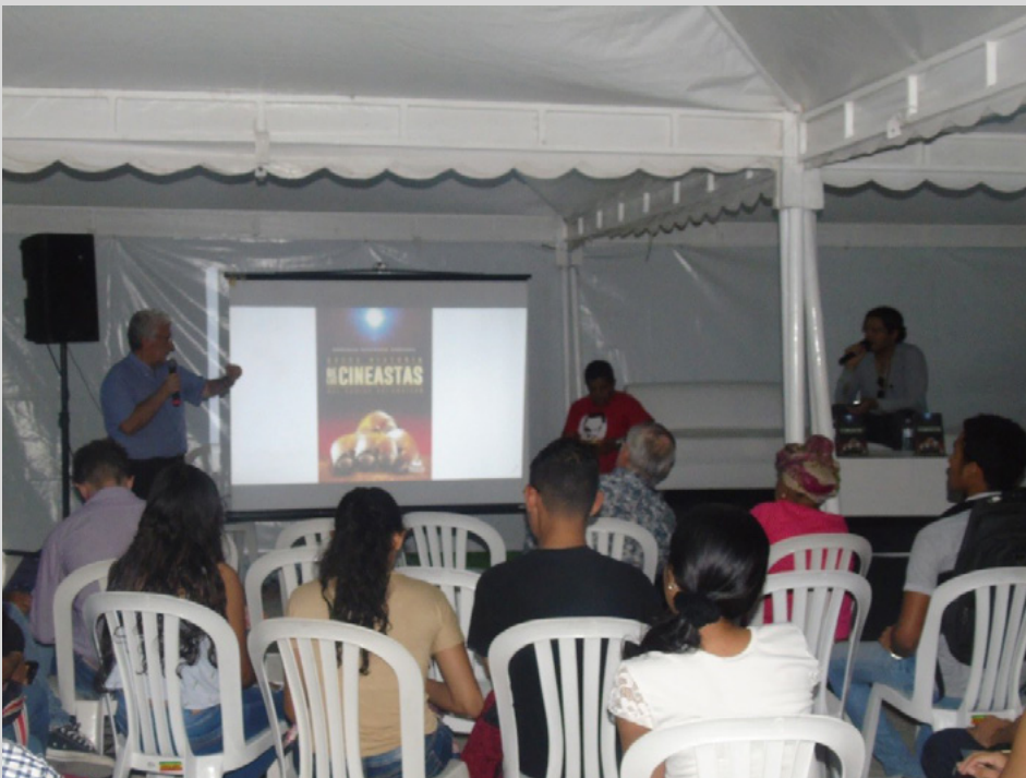
Figura 81. Lanzamiento de la obra en el marco de la Feria del Libro de Santa Marta, 2019