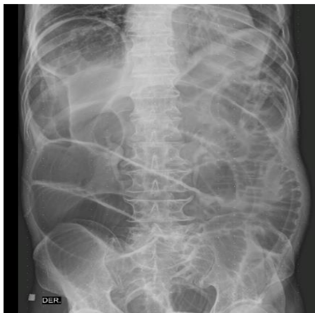
Figura 1. Radiografía simple de abdomen que muestra distribución anormal del gas en tracto digestivo, aumento del diámetro intraluminal en las asas.

Seguidamente se realizó tomografía computarizada (TAC) de abdomen donde se observó el cambio de calibre con imagen de medio remolino (Figura 2a), con pequeños ganglios de hasta 0,79 mm (dos) (Figura 2b), sin evidentes engrosamientos murales. Dilatación de las asas de intestino delgado, que alcanzan diámetros de hasta 6 cm, con nivel hidroaéreo, cambios del calibre a nivel del íleon distal en el flanco derecho (Figura 2c). Retrógradamente colapso del marco colónico, con escasas burbujas de aire en el colon transversal distal y del descendente proximal, con escasas burbujas de aire residual en la ampolla rectal (Figura 2c). Escasa cantidad de líquido libre en la excavación pélvica y a nivel subhepático derecho el signo de Chilaiditi (Figura 2c).