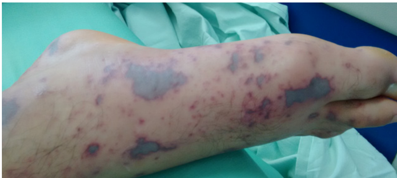
Figura 1. Lesiones en piel características de meningococcemia.

Se realizaron diferentes paraclínicos que evidenciaron alteración de las pruebas de coagulación con prolongación del Tiempo Parcial de Tromboplastina (TPT) con un valor máximo de 45 seg (control de 24 seg), y aumento del INR con valor máximo de 1,9 (Tabla 1). Además de esta alteración, se documentó trombocitopenia con valores mínimos de 60.000 plaquetas/ \mu L, y aumento de los productos de degradación de