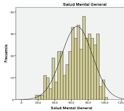
Figura 2: Salud mental general.

Media = 77,0 Desviación estándar = 16,133 N = 465