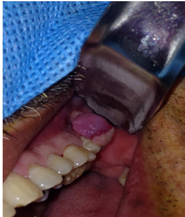
Figura 1. Imagen clínica del hemangioma capilar oral

el cual acude a la clínica odontológica de la Fundación Hospital Universitario Metropolitano (FHUM), por presentar lesión tumoral de aproximadamente 11 x 10 mm de diámetro en el maxilar superior a nivel del segundo y tercer molar izquierdo, con relación al fondo del surco, color rojizo/violáceo con zonas hiperqueratósicas blanquecinas y sin llegar a producir asimetría facial, asintomático de evolución desconocida por el paciente (Figura 1).