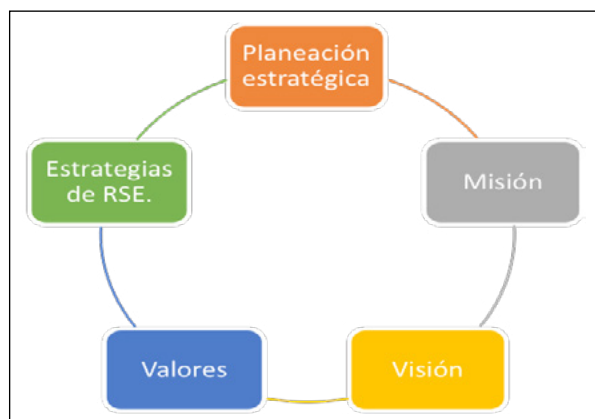
Figura 1. La RSE en el sector minorista y su articulación en la planeación estratégica.