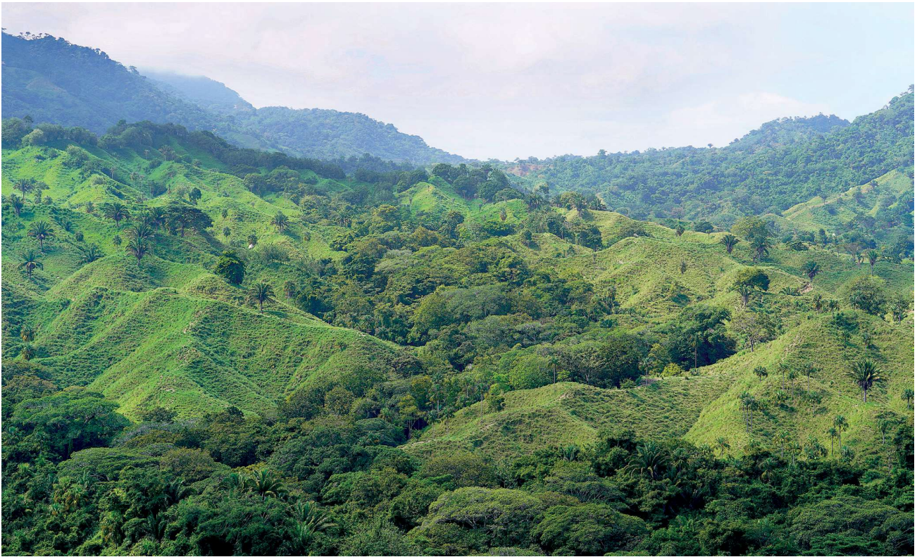
Sierra Nevada de Santa Marta.