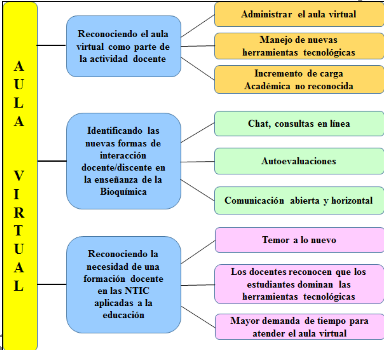
Figura 1. Percepciones de los docentes de Bioquímica sobre el aula virtual

Se obtuvieron varias categorías que salieron del análisis de los discursos o testimonios. En total fueron tres, las cuales se muestran en la figura 1 y se describen a continuación.