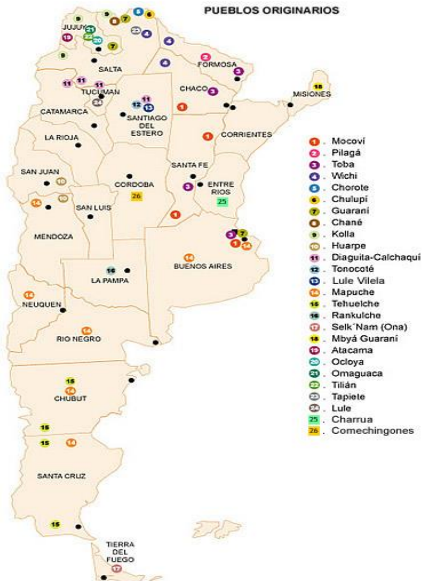
Figura 1. Distribución de los pueblos originarios en la República Argentina.

En la figura 1 podemos observar la distribución de diferentes pueblos originarios a nivel nacional, siendo la provincia de Santa Fe el foco de este trabajo.