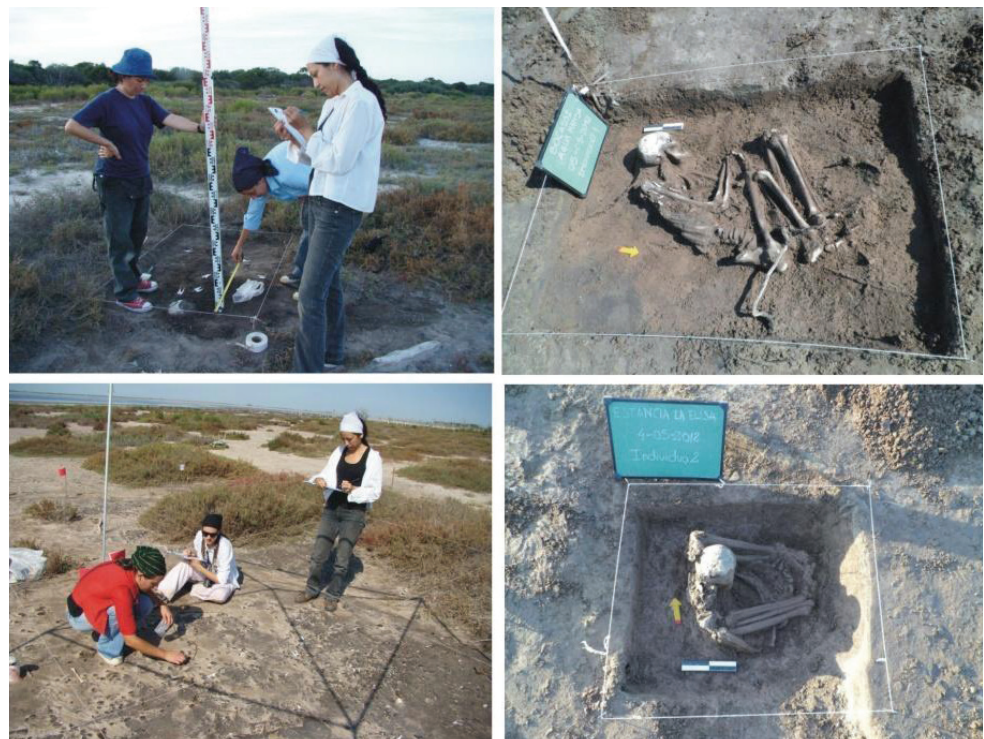
Figura 3a y b). Sitio Isla Orihueña 11 Playa Sudeste, 3c). Sitio Campo Bocassi-Agua Mansa 12, 3d). Sitio Estancia La Elisa 012, individuo 2.

A 200 m en dirección Norte del individuo 1, se identificaron restos correspondientes a otro individuo, denominado 2 ( 30^{\circ} 44' 180'' LS, 062^{\circ} 56' 813'' LO). Se trata de un único individuo completo, en buen estado de conservación, inhumado en una fosa primaria, orientado en dirección Oeste-Este, posición sedente, con los miembros inferiores hiperflexionadas sobre el torso, el miembro superior derecho semiflexionado debajo del fémur derecho y el miembro superior izquierdo semiflexionado por debajo de fémur, tibia y peroné izquierdos. Según el análisis bioantropológico se pudo determinar que se trata de un individuo masculino, adulto, de entre 35 y 46 años de edad. Hasta el momento solamente se ha realizado el relevamiento de patologías dentales en este individuo. Presenta un total de 13 piezas dentales y 28 alveolos. Se registraron una caries en superior derecho y un absceso periapical en primer molar inferior izquierdo. Se observó un elevado desgaste dental en todas las piezas dentales. Se realizó un fechado radiocarbónico sobre este individuo, que lo ubica en 4058 \pm 89 años ^{14}\text{C} AP (AA102655, falange proximal derecha).