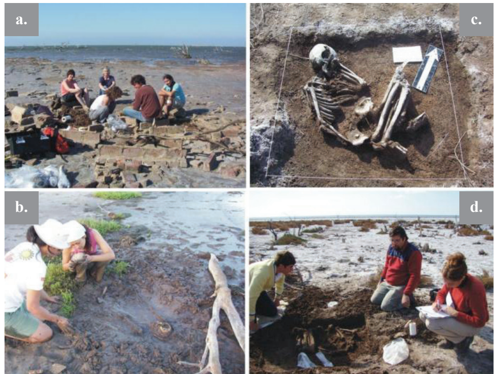
Figura 2a) Sitio Colonia Müller, 2b) Sitio Isla Orihuea, 2c) Sitio Orihuea, 2d) Sitio Estancia La Elisa 09.

Los análisis bioantropológicos permitieron determinar que se trata de un individuo de sexo femenino, adulto, sin poder acotar un rango de edad debido al mal estado de conservación de los elementos óseos diagnósticos. Este individuo presenta sólo una pieza dental (canino superior izquierdo) y 16 alveolos. Presenta gran cantidad de pérdidas dentales antemortem , un total de 11, y no presenta abscesos. La columna vertebral se encuentra afectada por osteofitosis en C4, C5, T7, T8 y T9 (grado leve) y en T11, T12 y L1 (moderado), y por porosidad (grado leve) en T11, T12, y L1 a L5. Se realizó un fechado radiocarbónico sobre el individuo 1, que lo ubica en 487 \pm 45 años C^{14} AP (AA102657, dos carpos izquierdos).